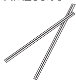
ビニタイ (Twist Ties)

同封されているビニタイ (Twist Ties)を靴ひもに通した後に計測チップの穴に通します。