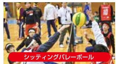
シットイングバレーボール

*当日、写真撮影を行い広報等で使用する場合がありますので、不都合がある場合はお申し出ください。