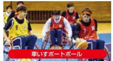
車いすポートボール